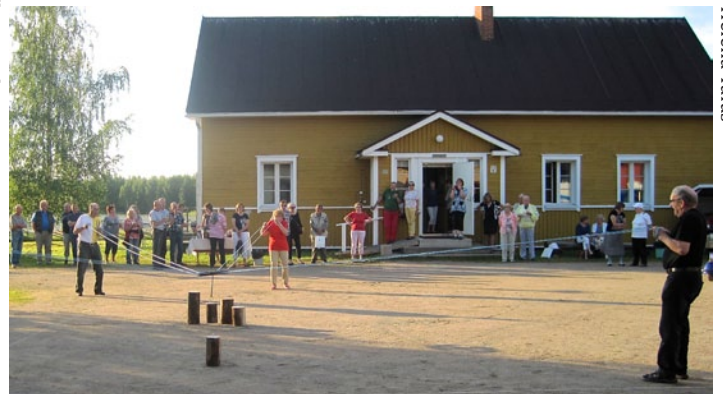
Viisi joukkuetta kisasi leikkimielisessä koukkupölkkykilpailussa Vesihelmijuhlan ulkoilmatahtumassa. Kuvassa kolmanneksi sijoittunut Eläkeliiton joukkue.